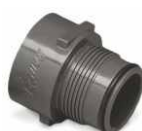
adapter 1,5" BSP/ACME