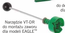
Narzędzie VT-DR do montażu zaworu dla modeli EAGLE™