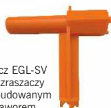
Klucz EGL-SV do zraszaczy z wbudowanym zaworem