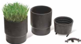
Koszyk na trawę Sod Cup przeznaczony do zrasczaczy 8005 (montowany na części wynurzalnej)