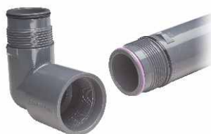
kolano 1,5" ACME OUTLET/SWING JOINTS